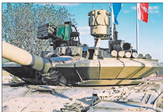
8. ábra. Az Arena-E aktív védelmi rendszer egy T-72-es harckocsi tornyán

Utódja az Arena, már a '90-es évek korszerűbb technikáját alkalmazta. A tornyon továbbra is egyetlen, méretes radart helyeztek el, de ennek látószöge már közel 300°-os volt. A célok sebességtartományát ezúttal 70 és 700 m/s között