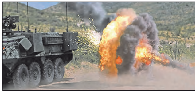
13. ábra. A Quick Kill APS működés közben

A „gyors ölés” fantázianevű eszközt 2007 környékén az amerikai Raytheon cég alkotta meg a hagyományos radar-repez recept alapján. Miután a Trophy-val való összeha-