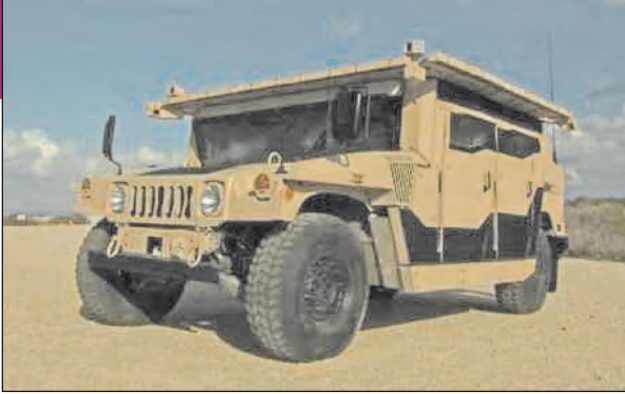
12. ábra. Trophy LV aktív védelmi rendszer egy Humvee katonai terepjárón. A négy sarokban jól láthatók az érzékelők

kozottan jelentkezik a saját gyalogság veszélyeztetése, amit az izraeli mérnökök a repesztöltet fókuszálásával, illetve pontosabb radarral próbálnak orvosolni.