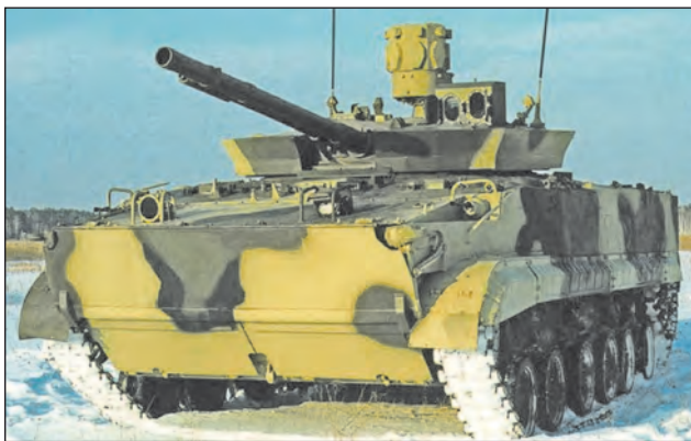
9. ábra. Az Arena-E elég könnyű ahhoz, hogy lövészpáncélosra is elhelyezhessék. A képen egy BMP-3-as harcjármű

zonyosodott, hogy a repeszek ugyan nem semmisítették meg a jelentős mozgási energiájú lövedéket, mégis módosították annyira a pályáját, hogy a becsapódás már számos esetben nem volt képes áttörni a páncélzatot.