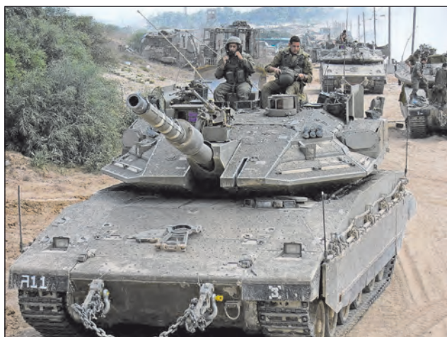
11. ábra. A Merkava Mk4-esen az APS már nem utólag felszerelt eszköz, hanem a gyártás kezdetétől a konstrukció szerves része

Az izraeli Rafael cég a 2000-es évek elejétől fejlesztette saját hard-kill rendszerét, amelyet 2007-ben Trophy, azaz „trófea” néven mutattak be. Szinte azonnal döntés született arról, hogy a Merkava legújabb változatán a 2004-ben rendszeresített Mk4-esen széria-felszereléssé teszik az eszközt, illetve 2009 óta a régebbi verziókat is folyamatosan felszerelik vele. Pontos paraméterei nem ismertek, illetve a folyamatos fejlesztések miatt változnak is, de az biztos, hogy már a legkorábbi változat is 360°-os védelmi zónát biztosít, és a repesztölteteket 10-30 méteren belül megsemmisítik a támadó rakétákat.