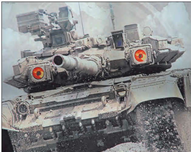
10. ábra. T-90A harckocsi a Shtora aktív védelmi rendszerrel. Ez volt az egyik első kép, amely a rendszerről megjelent a nyugati sajtóban

Még a szovjet idők végén, 1988-ban fejlesztették ki a Shtora, azaz „függöny” nevű, ködvető elven működő aktív védelmi rendszert (soft-kill APS-t), amelyet aztán 1995-től szereltek fel nagyobb számban T-90-es harckocsikra [18] és máig alkalmazásban vannak. Ez a rendszer kizárólag a lézervezérlésű rakéták (pl. HOT, TOW) ellen nyújt védelmet, de azok ellen kimagasló hatékonysággal. A torony két oldalán elhelyezett lézerszenzorok vízszintesen elvben körkörös, függőlegesen mintegy 30°-os érzékelési tartománnyal rendelkeznek, és nem csupán detektálják a lézert, de a forrás irányát is meghatározzák néhány fok pontossággal. Ezt követően a megfelelő szögben aktiválódnak a körben elhelyezett füstgránátok, és kb. három másodperc alatt mintegy 50-70 méteres füstfalat hoznak létre a lézer irányában, amelyet nagy erejű infrafénnyel világítanak meg, teljesen elvakítva a közeledő rakétát. A füst kb. 20 másodperc múlva eloszlik. Mivel a rendszer tömege mindössze 400 kg, a későbbiekben BMP-3-as lövészpáncélosokat is ellátták vele.